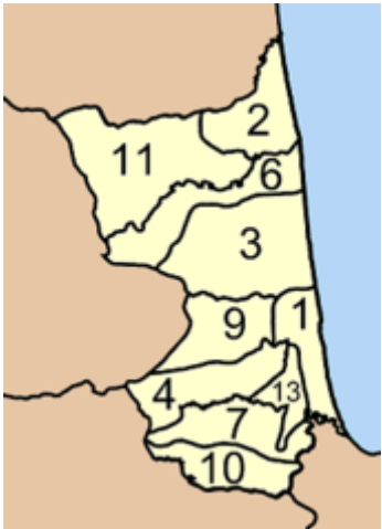
ภาพที่ 1 การปกครองส่วนภูมิภาค

เมื่อกล่าวถึงท่าศาลา ในเมืองท่าศาลาที่เป็นตำบลท่าศาลา เป็นตำบลในเขตการปกครองของอำเภอท่าศาลา ซึ่งประกอบด้วยจำนวน 15 หมู่บ้าน ได้แก่ หมู่ 1 บ้านตลาดท่าศาลา, หมู่ 2 บ้านเตาหม้อ, หมู่ 3 บ้านท่าสูง, หมู่ 4 บ้านท่าสูงบน, หมู่ 5 บ้านในถุ้ง, หมู่ 6 บ้านสระบัว, หมู่ 7 บ้านหน้าทับ, หมู่ 8 บ้านปากน้ำใหม่, หมู่ 9 บ้านด่านภาษี, หมู่ 10 บ้านบ่อนนท์, หมู่ 11 บ้านฝายท่า, หมู่ 12- หมู่ 13 บ้านในไร่, หมู่ 14 บ้านแหลม, หมู่ 15 บ้านบางตง (วิกิพีเดีย สารานุกรมเสรี, 2562) อำเภอท่าศาลาแบ่งเขตการปกครองออกเป็น 10 ตำบล 110 หมู่บ้าน รายละเอียดแผนที่ตั้งอำเภอท่าศาลา ปรากฏดังภาพที่ 1 การปกครองส่วนภูมิภาค